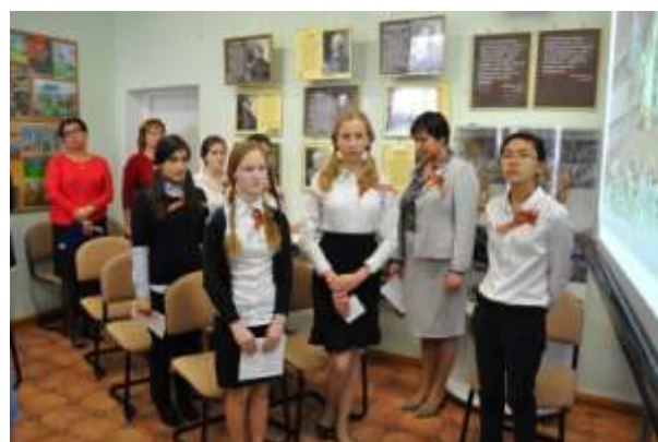
Классный час в музее Воинской славы (9 класс)