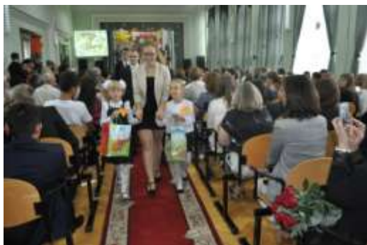
Первый раз в первый класс (1 сентября)