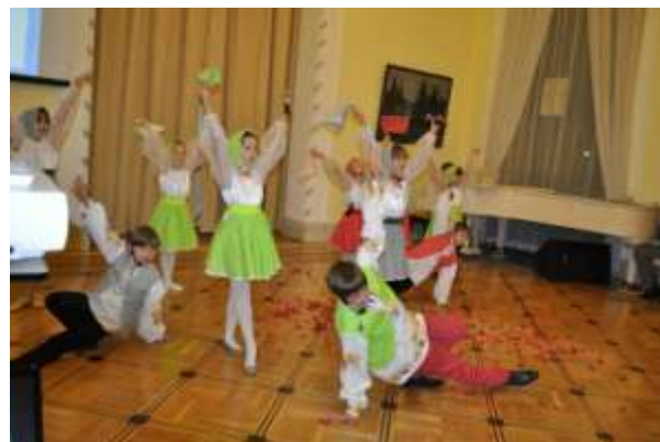
Концерт в Посольстве России