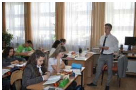
Урок русского языка в 8 классе (День учителя)