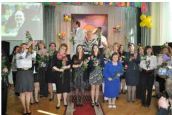
Поздравление учителей учащимися школы с их профессиональным праздником