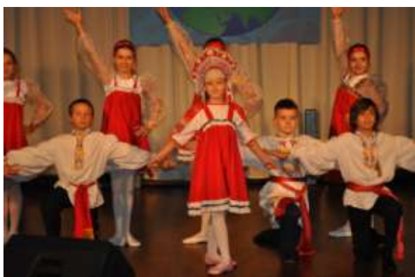
Выступление в РЦНК