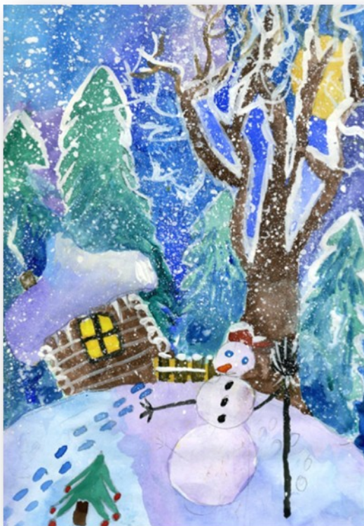
Рассимоф Лео, 4 класс