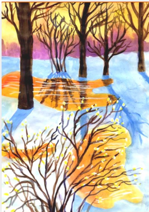
Карапетян Лусине, 7 класс