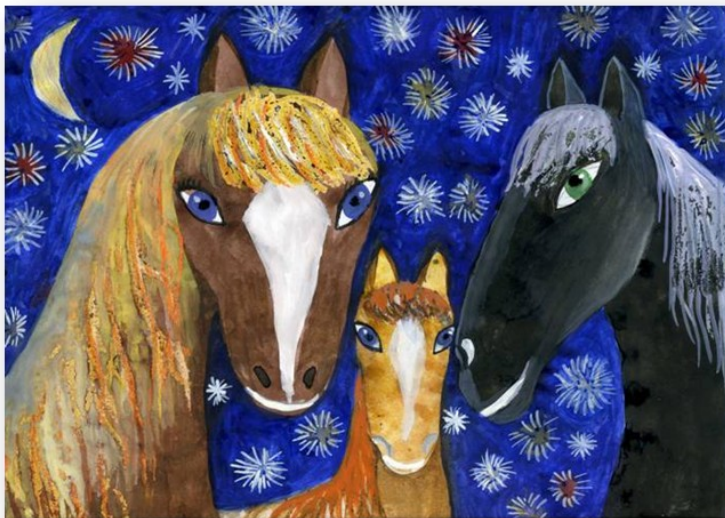
Мельничук Карина, 5 класс