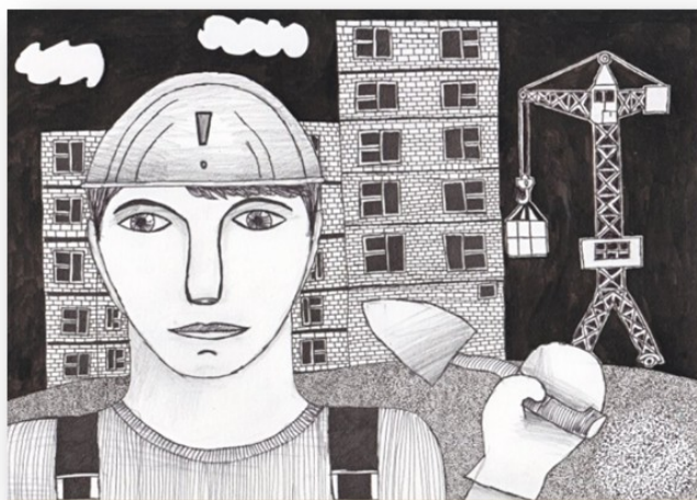
Полянская Анастасия, 6 класс