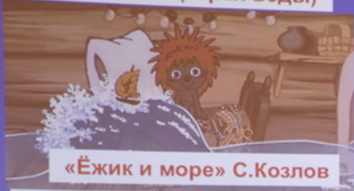
«Ёжик и море» С.Козлов