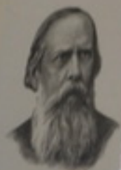
Михаил Герасимович САЛТИКОВ-ЩЕДРИН 1826-1889