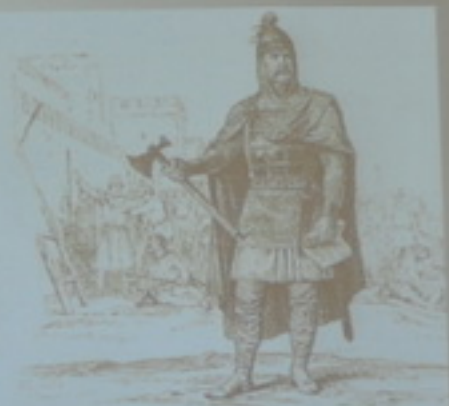
Верещагин В.П. «Олег Правитель» (из альбома рисунков «История Государства Российского в изображениях Державных его Правителей»)