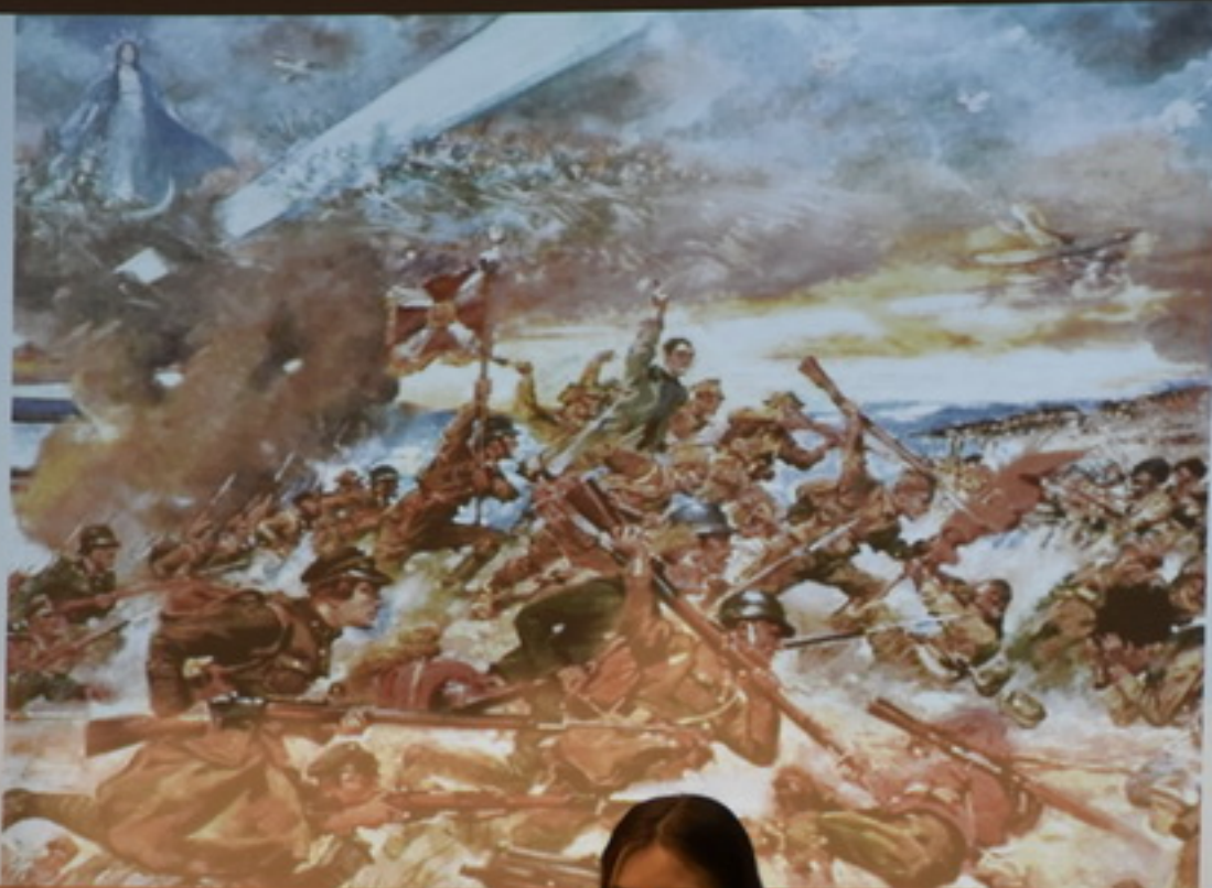
Картина «Чудо на Висле» Ян Матейко